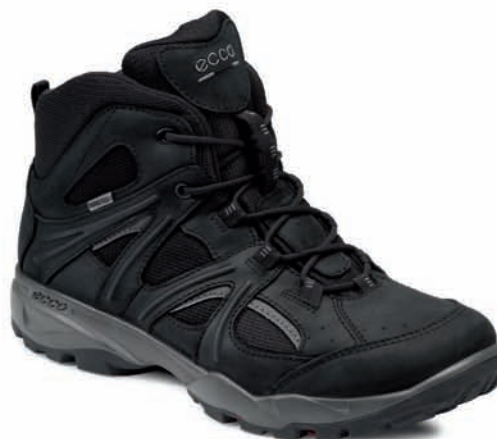
Ecco GORE-TEX® Damen € 130,- // Herren € 150,-