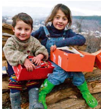
Schenken Sie Kindern in Not Freude mit der Aktion „Weihnachten im Schuhkarton“.