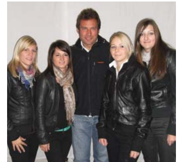
Das Projektteam der HAK Eferding mit Stargast Hannes Trinkl.

Helme zu tragen, erstellt hatten. Stargast des Abends war SchiWeltmeister Hannes Trinkl, der den Gästen seinen Leitspruch mitgab: „Lieber mit Helm auf der Piste und abends in die Hütte, als ohne Helm und abends im Krankenhaus“. Die zahlreich erschienenen Fans freuten sich über persönliche Autogramme des sympathischen Schistars. ■