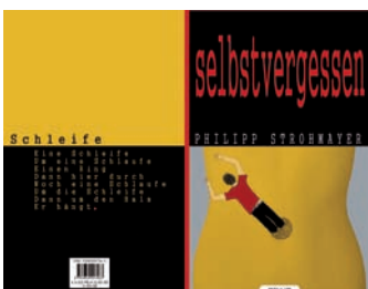
Strohmayers erstes Werk.

In seinem Erstlingswerk „selbstvergessen“ durfte er erstmals sein lyrisches Talent zeigen. ■