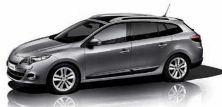
Der neue Renault Megane Grandtour mit großzügigem Raumangebot.

satz für die gesamte Laufzeit. Mit Beratung, Finanzierung und Service bieten wir von Renault Krieger umfassende Unterstützung rund um Ihre berufliche Mobilität. Reden Sie mit uns, wenn die Anforderungen an Ihre Fahrzeuge ganz spezielle Lösungen erfordern. Die breite Modellpalette von Renault macht die Auswahl leicht. Wir haben auch die gesamte Dacia Modellreihe in unserem Angebot. Verkaufsteam Renault Krieger Grieskirchen, Tel: 07248 / 68066 und Ried, Tel: 07752 / 84282. ■ Anzeig