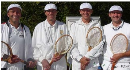
Die Bad Schallerbacher Tennisspieler beim Holzschläger-Tennisturnier in Berlin.