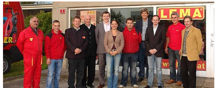
Bei der Hausmesse der Firma LEMA in Eferding wurden zahlreiche Produkte den Besuchern vorgestellt.