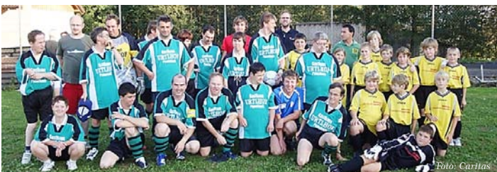
Die Fußballer aus St. Pius und Taufkirchen.

konnte sich für beide Mannschaften sehen lassen. Seit einigen Jahren treffen sich die beiden Mannschaften zwei Mal im Jahr. Das Besondere daran ist das Zusammentreffen von Sportlern mit und ohne Beeinträchtigung. Der „integrative Gedanke“ wird dabei von allen er- und gelebt. ■