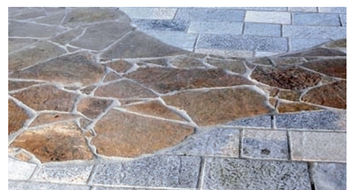
Die Fa. Arthofer Gustav bietet Ihnen Natursteine in vielen verschiedenen Farben und Formen.