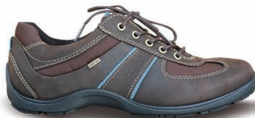
Ecco GORE-TEX® Damen € 99,90