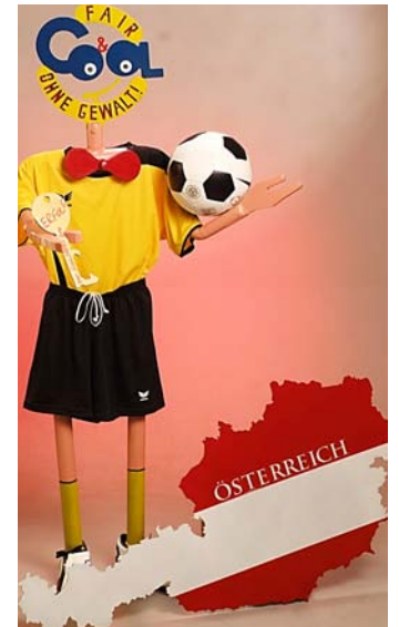
„Fair & Cool“-Symbolfigur.

für Fairplay sein. Auf der Homepage: www.fair-cool.at erfahren Sie weitere Einzelheiten über das Projekt „Fair & Cool“. ■