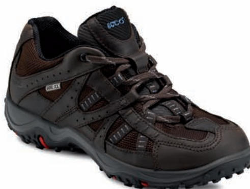
Ecco GORE-TEX® Damen € 120,- // Herren € 140,-