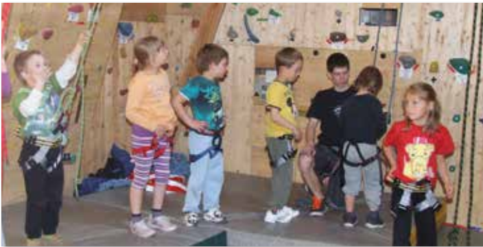
Die Naturfreunde Grieskirchen bieten einen Vorschul-Kletterkurs an.

nehmer, für jedes weitere Kind EUR 90,-. Die Kletterausrüstung wird beigelegt. Mitzubringen: Sportbekleidung, lange oder kurze Hose und Laufschuhe mit einer relativ steifen Sohle, Getränk zur Flüssigkeitszufuhr in den Pausen. Anmeldung unter naturfreunde.grieskirchen@aon.at, Tel. 0664/ 35 50 069 oder im Naturfreunde-Heim Grieskirchen Manglbürg 13a. ■