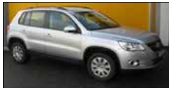
VW Tiguan 2,0 TDI CR DPF 4Motion Trend&Fun EZ: 12/2009, 68.459 km, 140 PS