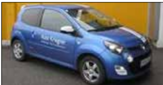
Renault Twingo TCe 100 Gordini GT EZ: 09/2013, 13.942 km, 102 PS