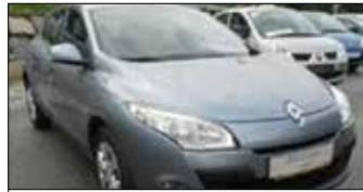
Renault Mégane Tonic 1,6 16V 100 EZ: 09/2010, 39.731 km, 101 PS