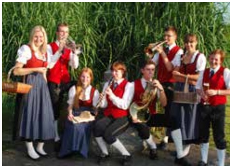
Der Musikverein St. Georgen bei Grieskirchen lädt zum Frühjahrskonzert.