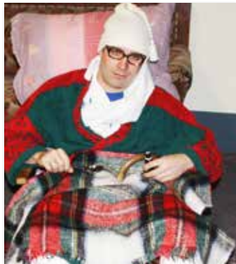
Die Theatergruppe Samarein spielt das Lustspiel „Der kerngesunde Kranke“.

27. und 28. März jeweils um 20.00 Uhr 29. März um 14.00 Uhr ■