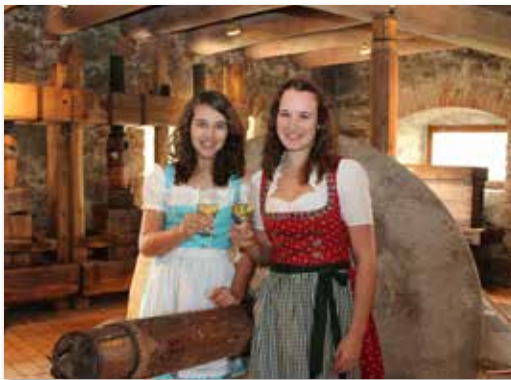
In St. Marienkirchen/P. findet wieder die traditionelle Mostkost statt.

kost folgt dann am Samstag ab 16 Uhr. „BARadies“ die Bar auf der Mostkost ist an allen drei Festtagen geöffnet. Am Sonntag folgt ab 10 Uhr der Frühschoppen im Gemeindezentrum. Ein weiterer Höhepunkt ist der Samareiner Kirtag sowie der Tag der offenen Tür im Most- und Heimatmuseum. Ausschank im Samareiner Mostspitz durch den Obstbauverein. ■