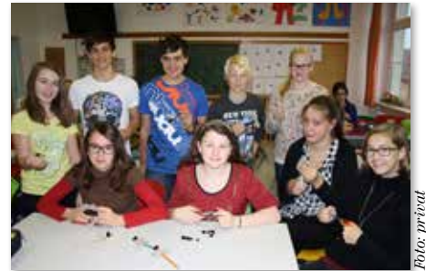
Schüler/innen der Neuen Mittelschule Hartkirchen beim Herstellen des „fliegenden Bleistiftes“ zugunsten des Projektes „Onyii Fly“.