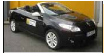
Renault Mégane Floride Energy dCi 130 EZ: 06/2013, 18.573 km, 131 PS