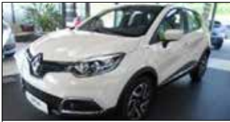
Renault Captur Dynamique ENERGY dCi 90 EZ: 01/2014, 9.022 km, 90 PS