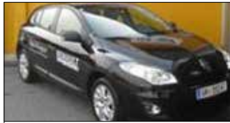
Renault Mégane Tonic 1,6 16V 100 EZ: 05/2013, 26.650 km, 101 PS