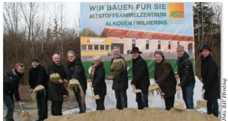
In Alkoven entsteht ein neues bezirksübergreifendes Altstoffsammelzentrum.

genannten Gemeinden und bietet ca. 12.000 Einwohnern eine qualitätsvolle Möglichkeit der Altstoffentsorgung. Das neue ASZ umfasst auf einer Gesamtfläche von ca. 6.000 m 2 nunmehr auch eine Strauch- und Grünschnittannahmestelle und kann bei einem guten Baufortschritt bereits im September 2015 eröffnet werden. Errichtet wird das neue Sammelzentrum vom Bezirksabfallverband Eferding in Kooperation mit dem BAV Linz-Land. ■