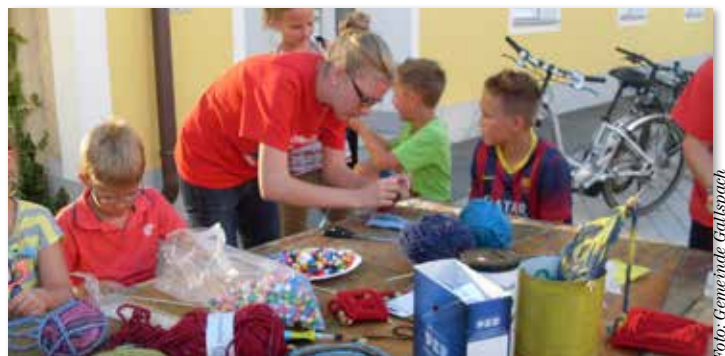
In Gallspach werden wieder die Bummelnächte veranstaltet.

hochstapeln, Fußball-Ballspiele, Geschicklichkeitsspiele und vieles mehr auf dem Programm. Für die Bewirtung sorgen das Hotel Wienerhof, Cafe Pub S'Gallspacher, Weinkraft Meindlhumer und Lars Boje. Eintritt: frei. Info-Hotline: 0664/4901091. ■