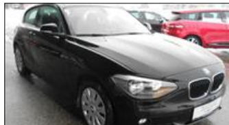
BMW 114i Österreich-Paket EZ: 02.2013, 24.870 km, 102 PS