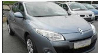
Renault Mégane Tonic 1,6 16V 100 EZ: 09/2010, 39.731 km, 101 PS