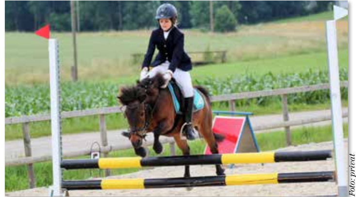
Am 12. Juli findet in Waizenkirchen das 1. CSN-C Springturnier statt.

Auf der Anlage des Union Team Happy Horse