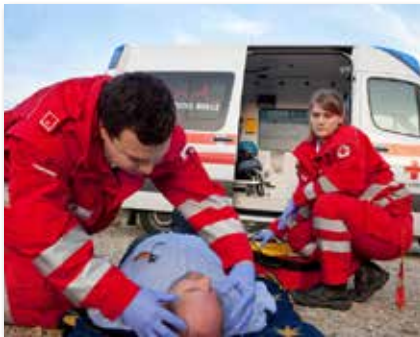
Ein Rot-Kreuz-Sanitätterteam prüft die Vitalfunktionen eines Notfallpatienten.