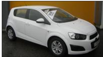
Chevrolet Aveo 1,2 ECO LT EZ: 05.2013, 9.998 km, 86 PS