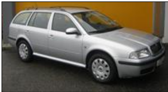
Skoda Octavia Combi 1,6 Active TDI CR DPF EZ: 04.2010, 202.574 km, 105 PS