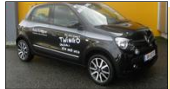
Renault TWINGO EZ: 09.2014, 6.940 km, 71 PS