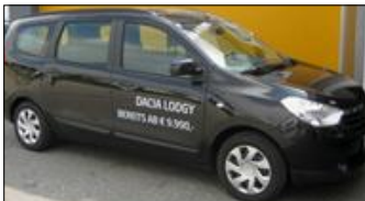
Dacia Lodgy Lauréate TCe 115 EZ: 05.2014, 13.731 km, 116 PS