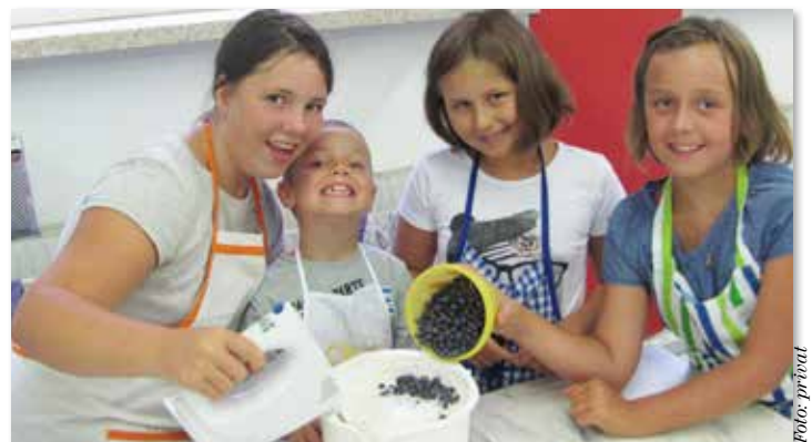
Großen Spaß hatten die Kinder beim Kochkurs in Hartkirchen.

Kleine Feinschmecker kochen ganz groß auf