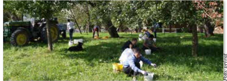
„Obstklaubm – nix vawiastrn“ heißt es im Naturpark Obst-Hügel-Land.

Sozialprojekt des Naturpark Obst-Hügel-Land