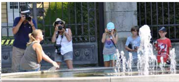
Bei einem Foto-Workshop entdeckten die Kinder die Welt der Fotografie.

Kinder entdeckten die Welt der Fotografie