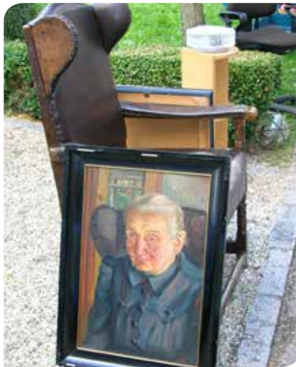
Der Flohmarkt am Eferdinger Schiferplatz findet am 17. April statt.

gangenheit umzusehen, bietet der traditionelle Flohmarkt am Schiferplatz in Eferding am Sonntag, dem 17. April von 8-16 Uhr. Der Flohmarkt findet bei jeder Witterung statt. ■