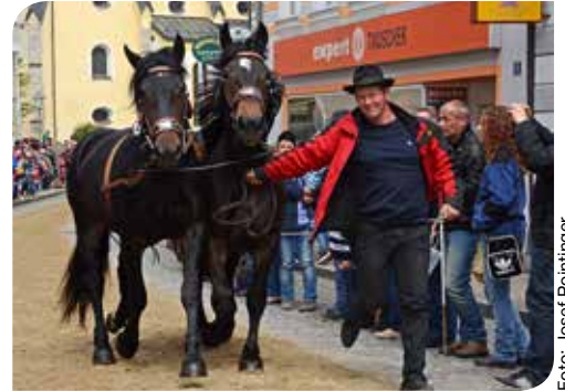
Am 23. April findet wieder der traditionelle Pferdemarkt in Peuerbach statt.

Prämierung zugelassen. Beim gleichzeitig stattfindenden Sommermarkt im Stadtzentrum werden Schuhe, Bekleidung, Spielsachen oder Haushaltsartikel, um nur einiges zu nennen, von ca. 80 Marktlieferanten angeboten. Um 14 Uhr startet die Preisverleihung. Alle Pferde werden gemeinsam in einem Zug zur Prämierung einmarschieren. Den