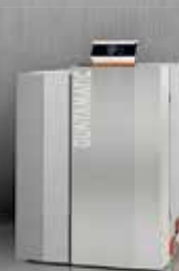
BMK Einzigartige Edelstahl- Stückholzheizung