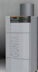
BIOSTAR Extrem sparsame und langlebige Pellettheizung