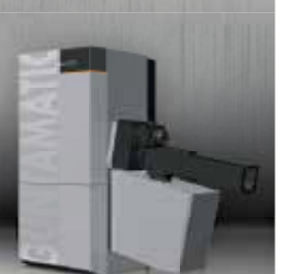
POWERCHIP Modernste Treppenrost- Hackschnitzelheizung