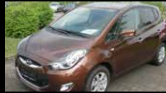
HYUNDAI ix20 1,4 CRDi EZ: 31.10.2014, 1,4 Liter Diesel, 90 PS, 13.500 km Jetzt nur € 15.490,-