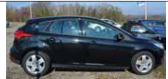
Ford Focus 1,5 TDCi Trend, schwarz - 95 PS, Klima, CD, ESP, Par- tikelfilter, Radio, Traktionskontrolle, WINTER-PAKET, TREND KOMFORT PAKET 1, B.J: 03.2015, Km: 34.783