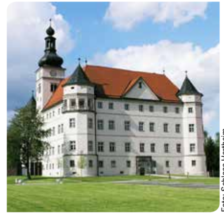
Im Lern- und Gedenkort Schloss Hartheim werden öffentliche Begleitungen durchgeführt.

Jeden zweiten Sonntag im Monat von 14:30 bis 16:00 Uhr werden im Lern- und Gedenkort Schloss Hartheim öffentliche Begleitungen durchgeführt. In dem geführten Rundgang durch die Ausstellung „Wert des Lebens“ und die Gedenkstätte, werden die wichtigsten Informationen zum Ort vermittelt. Die Kosten dafür belaufen sich auf EUR 3,- für Schüler/innen, Lehrlinge und Student/innen und EUR 5,- für Erwachsene. Die Ausstellung „Wert des Lebens“ sowie die Gedenkstätte und auch die Außenbereiche des Schlosses sind barrierefrei zugänglich. Es ist keine Anmeldung erforderlich; die Begleitung findet