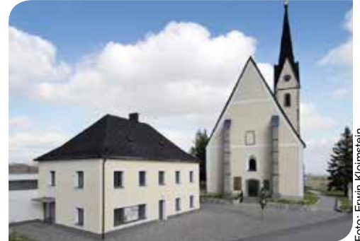
Das neue Pfarrzentrum Hl. Johannes in Stroheim.