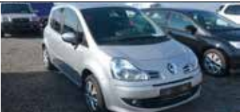
Renault Grand Modus Exception 1,2 16V Hi Flex - Benzin und Alkohol (E85), Schaltgetriebe 75 PS, CD, ESP, Traktionskontrolle, Alu, Airbag, Funk ZV, Klima Automatik, NS!!! Wartung+ZR+WAPU NEU, B.J: 11.2009, Km: 36.552