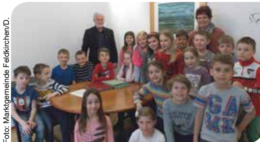
Die Feldkirchner Volksschüler besuchten das Gemeindeamt.

ellen Projekte der Gemeinde. In den einzelnen Abteilungen konnten sich die Schülerinnen und Schüler ein Bild von den vielen sehr unterschiedlichen Aufgabenbereichen eines Gemeindeamtes machen. Um einen detaillierten Einblick in die vielfältigen Aufgaben und Tätigkeiten der Gemeinde zu erlangen, erklärten die Bediensteten den Schülerinnen und Schülern ihre Aufgabenbereiche. Durch diesen Besuch konnte der theoretisch besprochene „Lernstoff“ betreffend der Gemeinde nun auch in der Praxis kennen gelernt werden. ■