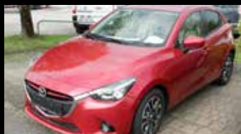
M2/G115/REVOLUTION TOP 1,5 Liter Benzin, 115 PS, Tageszulassung, Neulistenpreis € 22.780,- Jetzt nur € 18.640,-