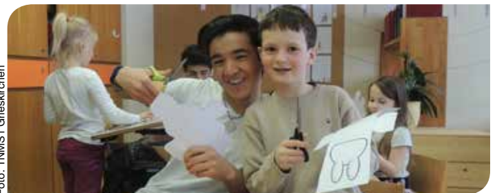
Kinder von Asylwerbern besuchten die Volksschule Pram.

Im Schulbezirk Grieskirchen werden derzeit 71 Kinder von Asylwerbern in den Pflichtschulen unterrichtet. In den Neuen Mittelschulen Grieskirchen werden Asylkinder in einem täglichen dreistündigen Sprachkurs besonders gefördert. Die übrige Zeit sind sie in unterschiedliche Klassen altersgemäß integriert. Schon zum zweiten Mal durften die Asylwerberkinder der beiden Technischen Neuen Mittelschulen TNMS1 und TNMS2 in Grieskirchen einen Vormittag mit den Pramer