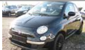
Fiat 500 Cabrio 1,4 16V Lounge Dualogic - 99 PS, Automat, Klima, Leder, CD, Einparkhilfe, ESP Radio, Sportsitze, Traktionskontrolle, WARTUNG... B.J: 01.2011, Km: 31.382