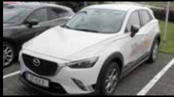
MAZDA CX-3/G120/SPORT EDITION EZ: 04.11.2015, 2,0 Liter Benzin, 120PS, 2.500 km, Neulistenpreis € 26.970,- Jetzt nur € 23.680,-