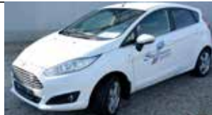
Ford Fiesta Trend 1,0 Start/Stop - Benzin, Schaltgetriebe 80 PS, Kli- ma, Traktionskontrolle, Fahrzeug mit 65PS! Winter-Paket, Notrad, getö- nte Seitenscheiben, B.J: 10.2015; Km: 1.546