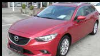
MAZDA 6/SPC/CD150/ATTRACTION EZ: 28.10.2014, 2,2 Liter Diesel, 150 PS, 16.800 km Jetzt nur € 25.850,-