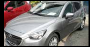
M2/G90/HAZUMI 1,5 Liter Benzin, 90 PS, Tageszulassung Neulistenpreis € 19.130,- Jetzt nur € 15.490,-