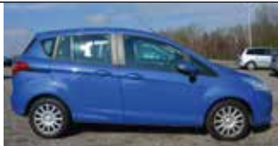
Ford B-MAX Trend 1,4 Duratec, blau - Benzin bleifrei, Schaltgetriebe 90 PS, Klima, CD, Radio, Traktionskontrolle, 8fach bereift, Anhängervor- richtung, B.J: 06.2013, Km: 46.848