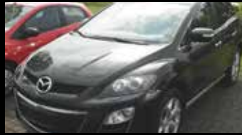
MAZDA CX-7/CD173/REV. TOP EZ: 28.09.2012, 2,2 Liter Diesel, 173 PS, 70.400 km Jetzt nur € 20.640,-