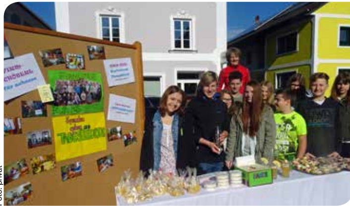
Firmlinge der Pfarre Feldkirchen/D. mit ihrem Stand beim Wochenmarkt.

Der Erlös von EUR 260,- wird an die Tagesstruktur Feldkirchen gespendet. Das Geld wird bei einem Besuch in dieser Einrichtung gemeinsam überreicht. ■