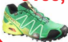
Salomon Speedcross 3 GTX