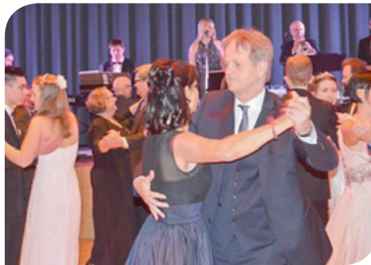
Beim Ball der Eferdinger wurde bis in die Morgenstunden getanzt.