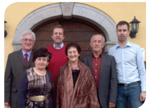
Vorstand der Volksbühne Pollham.