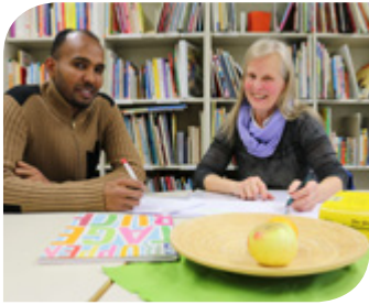
Die Caritas sucht Integrationslotsen in den Bezirken Grieskirchen und Eferding.

Angehende Integrationslotsen bringen ein Interesse an anderen Kulturen mit und haben für mindestens ein halbes Jahr ca. zwei bis vier Stunden pro Woche Zeit. Die Integrationslotsen sind haftpflicht- und unfallversichert. Die Caritas bietet den Freiwilligen regelmäßige Austauschtreffen und Weiterbildungen an und sie haben eine persönliche Ansprechperson an ihrer Seite. ■