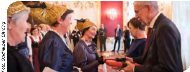
Eferdinger Goldhaubengruppe besuchte Bundespräsidenten Dr. Alexander Van der Bellen und seine Gattin Doris Schmidauer.

Annäherung. Frauen sind willkommen, sind ausdrücklich zugelassen und äußerst erwünscht, wenn sie versprechen, die letzten Geheimnisse der Männer nicht nach außen zu tragen. Ein Kabarettabend mit Lachgarantie. ■