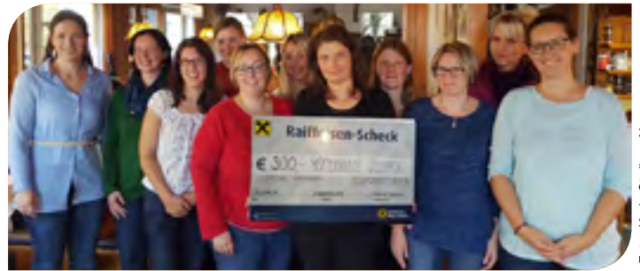
Die Mütterrunde Gallspace spendete den Erlös des Flohmarktes.

Der Erlös des Flohmarktes in der Höhe von EUR 300,- konnte wieder an die Herzkinder Österreich gespendet werden. Die Mütterrunde Gallspace bedankt sich ganz herzlich für das große Interesse der Besucher, dem Flohmarktteam für die tatkräftige Unterstützung als auch den vielen Sponsoren. ■