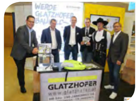
Die Kooperationspartner besuchten als „Generalprobe“ die hochmotivierten Lehrbetriebsverantwortlichen an deren Ständen!