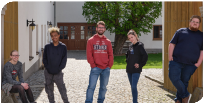
„Open Days“ der Einrichtung Hof Tollet.

Begleitung ihrer Eltern, herzlich dazu eingeladen, die Fokus Mensch-Einrichtungen zu besuchen. Dabei können sie sich selbst davon überzeugen, was ihnen diese Einrichtung bietet: Wie der Weg in ein selbstständiges und unabhängiges Erwachsenenleben aussehen kann und wie gemeinsam dieses Ziel erreicht werden kann. ■