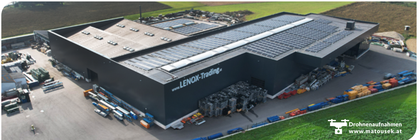
LENOX-Trading erweiterte seine Lagerfläche mit einem modernen Neubau.

trägen auch ein Sorglos-Paket an. Die besenreine Betriebsräumung umfasst den gesamten Flächenrückbau wie Dach, Wand, Boden inkl. sämtlichen Wasser- und Elektroinstallationsarbeiten. Es werden auch