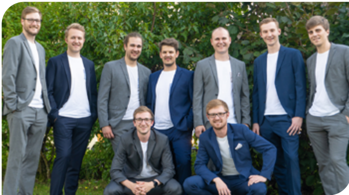
Die 9-köpfige Formation „Blech Brass Brothers“

ganz spezielle Note geben. Seit ihrer Gründung 2006 hat sich die Gruppe zu einem energiegeladenen Ensemble entwickelt. Die junge Musikerformation steht für innovative Blasmusik, die sich in unterschiedlichsten Stilrichtungen manifestiert: Traditionelle Stücke, Volksmusik und Popsongs mit Dialekt-Texten – der musikalischen Kreativität werden keine Grenzen gesetzt. ■