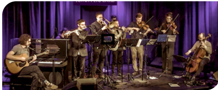
Konzert mit „Cler & Grätzlorchester“.