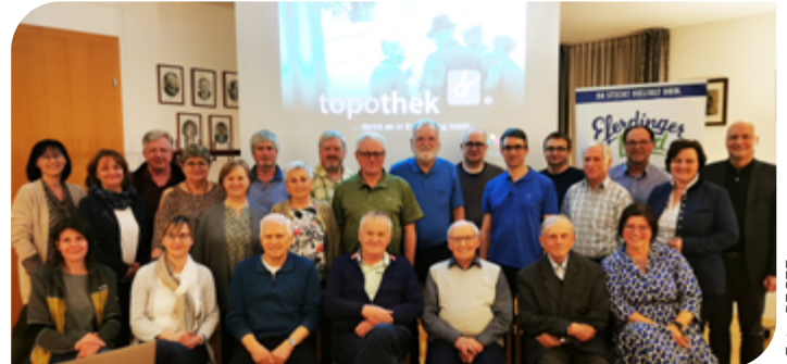
Treffen der Topothekare im Eferdinger Land.

Im April fanden Schulungen für die künftigen Topothekare statt. Mehr als 40 Interessierte haben sich bisher bei ihren Gemeinden gemeldet, um mitzuarbeiten. Weitere UnterstützerInnen sind jederzeit herzlich willkommen. Das Projekt wird bis Ende 2024 mit finanziellen Mitteln aus dem