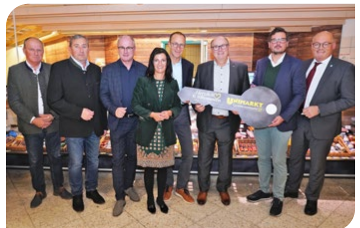
Gemeinsame Freude bei der Übergabefeier.

erfahrenen bestehenden Verkaufsteam vor Ort den Markt mit vergrößerter Fläche durch nachhaltige Umbaumaßnahmen zu übernehmen und somit die Nahversorgung in der Region St. Agatha und Umgebung für die nächsten zehn Jahre zu sichern. Am 10. November 2023 gab es aus diesem Anlass die offizielle Übergabefeier, an der auch zahlreiche Gäste aus der regionalen Politik und hochrangige Wirtschaftsvertreter teilnahmen. ■