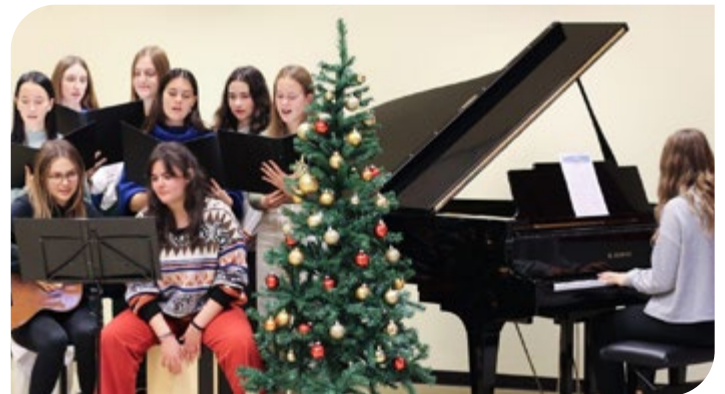
Weihnachtskonzert am BORG Grieskirchen.

Außerdem sollen besinnliche Texte auf das bevorstehende Weihnachtsfest einstimmen. Kleine kulinarische Köstlichkeiten runden den stimmungsvollen Abend ab. Eintritt: frei. ■