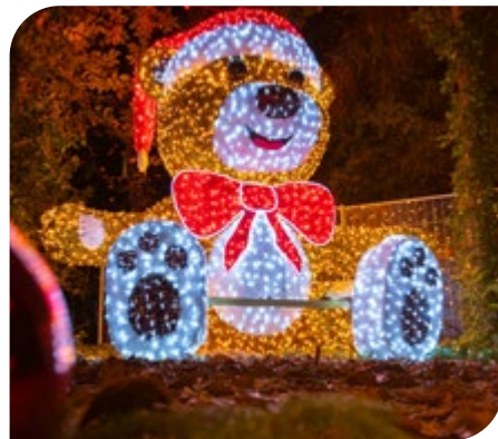
Marchtrenker Glitzerpark begeistert Groß und Klein.

Der Marchtrenker Glitzerpark hat noch bis zum 14. Jänner 2024 jeden Freitag bis Sonntag von 16-21 Uhr geöffnet. Alle Infos zum Glitzerpark: www.marchtrenker.gv.at/glitzerpark .