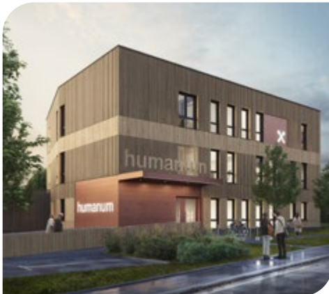
Visualisierung des neuen Ärzte- und Therapie-zentrums „humanum“ in Alkoven.