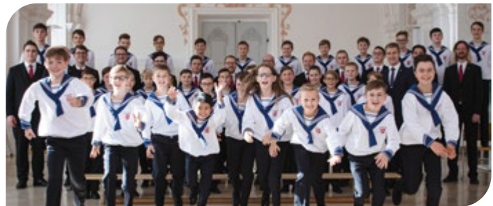
Adventkonzert der St. Florianer Sängerknaben.

Dieses Konzert ist Teil der 6-teiligen Reihe „Weltstimmen“. Mit einem Kombiticket um EUR 88,- können alle Veranstaltungen dieser Reihe besucht werden. Kombitickets sind unter tickets@musiksommerbadschallerbach.at erhältlich. ■