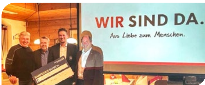
Scheckübergabe vom Rotary Club Linz-Altstadt.