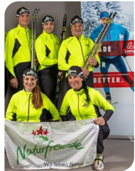
Das Langlauf Team der Naturfreunde Ottensheim.

lage auf der Homepage zu finden sind. Alle Veranstaltungen und weitere Infos unter: https://ottensheim.naturfreunde.at ■